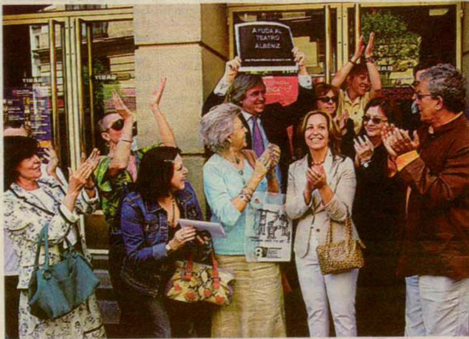
Representantes de la cultura y políticos, ayer, frente al teatro.

Desde 1997 era un bien protegido, pero los dueños plantearon un recurso y el Tribunal Superior de Justicia de Madrid les dio la razón en julio de 2005. Ahora podrá convertir-